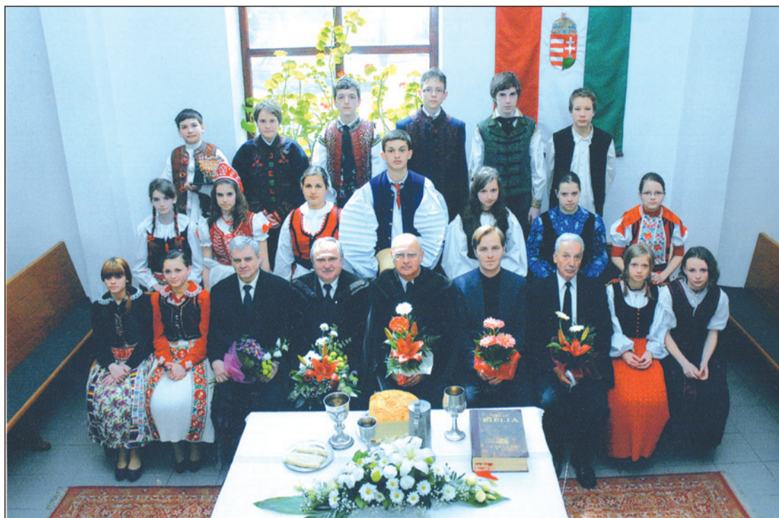
Konfirmáció a Pata utcai Fehér templomban 2012. április 22-én, konfirmált 10 lány és 7 fiú.