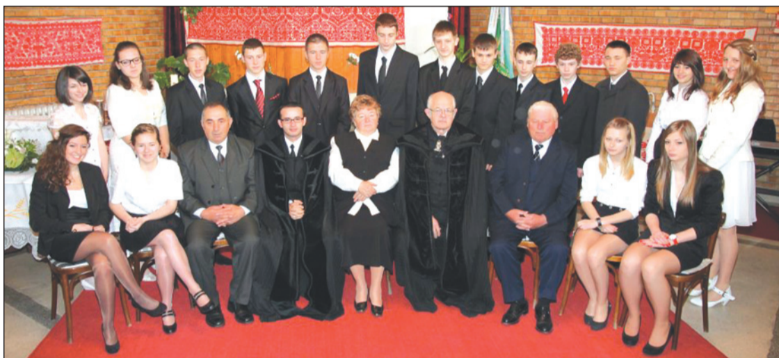
A Kerekdombon 17 fiatal – 9 fiú és 8 lány – konfirmált 2012. április 15-én. A kerekdombi reformátusok IFI zenekara kis ünnepi műsorral köszöntötte őket.